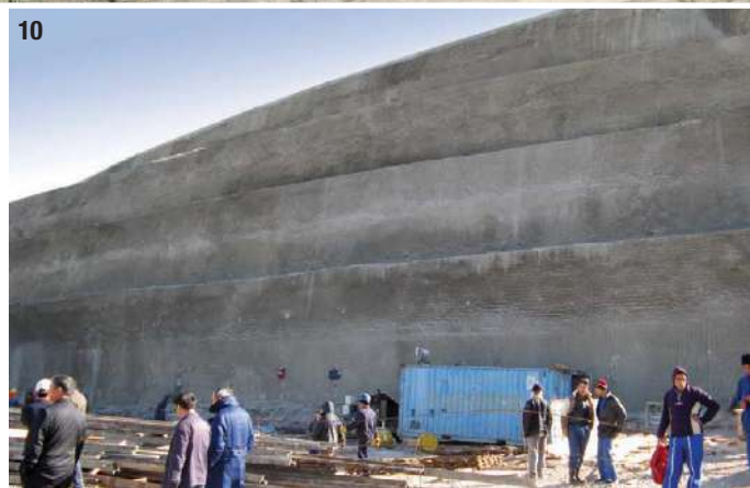
9- Gutter of clayey scree on a substratum of clayey schists of low resistance (earth cuts subsequently strengthened). 10- Very high soil-nailed wall.