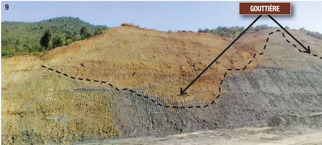
9- Gouttière d'éboulis argileux sur un substratum de schistes argileux de faible résistance (déblais ultérieurement renforcé). 10- Mur cloué de grande hauteur.